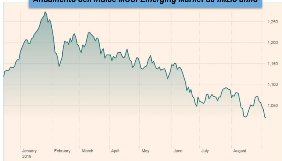
Andamento dell'indice MSCI Emerging Market da inizio anno

In un tale contesto, un potenziale investitore potrebbe guardare a gestori attivi che applicano strategie Long-Short, che siano in grado di assumere posizioni lunghe per cogliere le opportunità di mercato e di andare corti sulle aree dove si rischiano delle performance negative.